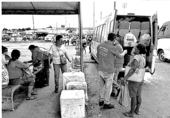
Movimentação de passageiros no terminal de vans, no KM 0 da BR-135, foi considerado alto na sexta-feira

de ontem, já tinha ocorrido um acidente, envolvendo um caminhão e uma motocicleta, no KM 4 da BR-135, apenas com danos materiais e ferimentos leves. "Houve aumento do fluxo de veículos na via federal, mas a polícia está atenta a qualquer tipo de