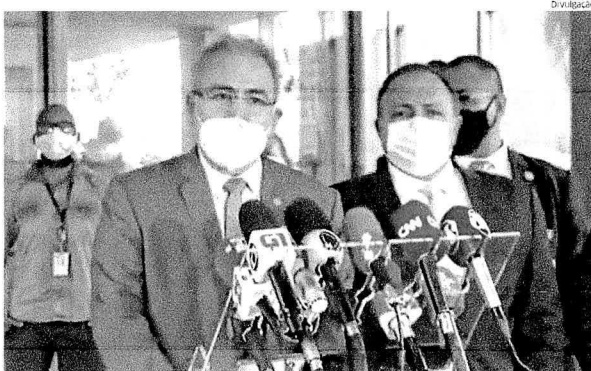
Marcelo Queiroga concedeu entrevista coletiva ao lado de Eduardo Pazuello, na tarde de ontem em Brasília

lhado desde o início do mandato do presidente Bolsonaro para melhorar a eficiência do SUS e algumas pautas que eram caras a sociedade médica como por exemplo a criação de secretaria de atenção primária, foi criada, hoje funciona e funciona de maneira satisfatória. A pandemia nos trouxe desafios, mas oportunidades, como a legislação para tecnologias de informação do programa Telesáude, pode ser útil para o acesso dos brasileiros ao SUS", completou.