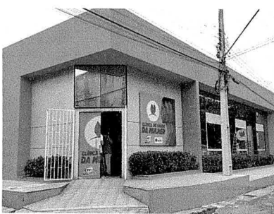
Clínica é a mais bonita, confortável e moderna da rede pública no estado

com os atendimentos médicos em diversas especialidades que serão oferecidos e agradeceu o empenho da atual gestão para que este sonho se tornasse realidade em tão pouco tempo de gestão. Médicos que prestarão atendimento falaram da importância da Clínica da Mulher em Barra do Corda e disseram que a clínica é a mais bonita, confortável e moderna na rede pública do Maranhão.