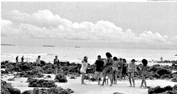
Famílias optaram por se divertir na praia; orla ficou bem concorrida na sexta-feira e faltou o uso de máscaras

"Todo fim de semana eu estou aqui. Acredito que pela questão do